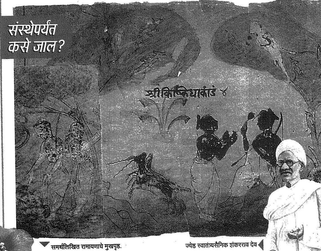
समर्थलिखित रामायणाचे मुखपृष्ठ.